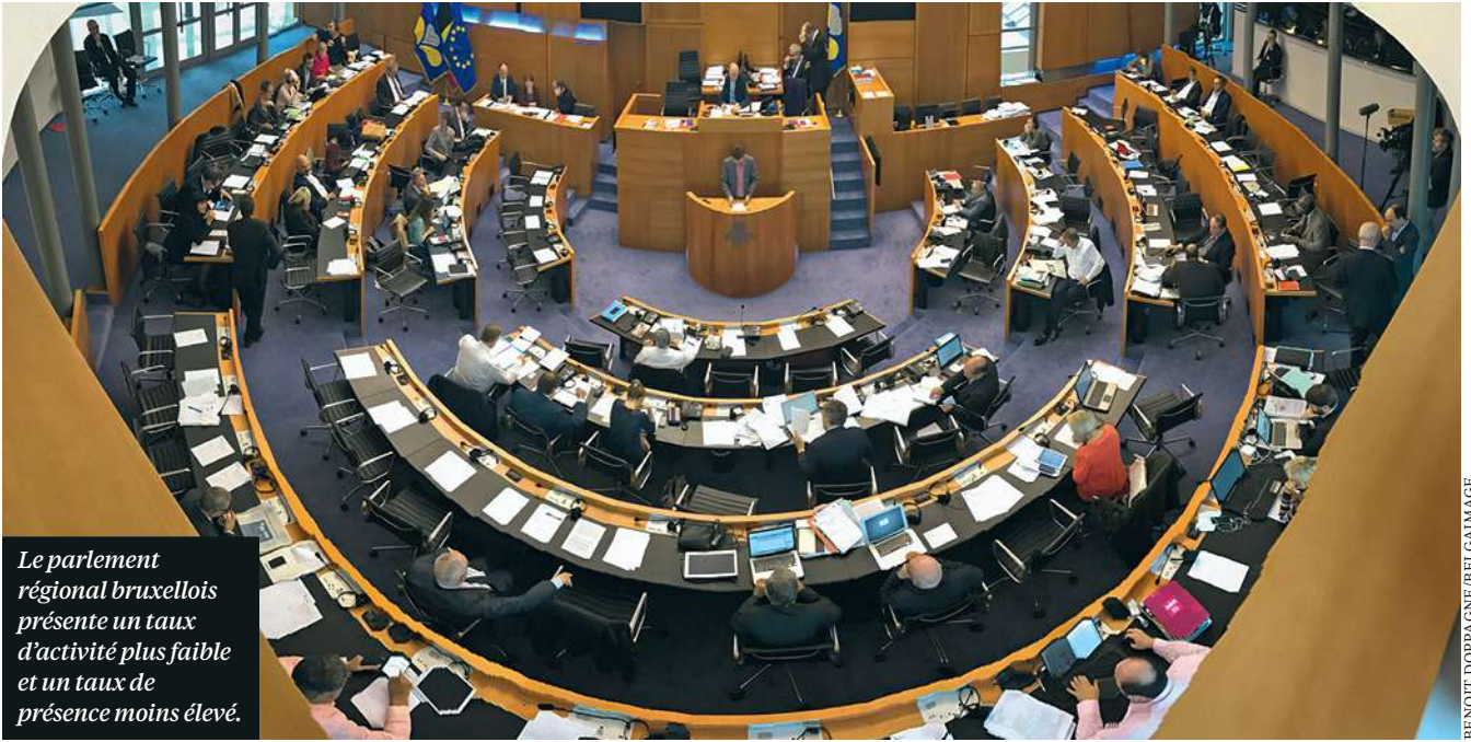
Le parlement régional bruxellois présente un taux d'activité plus faible et un taux de présence moins élevé.