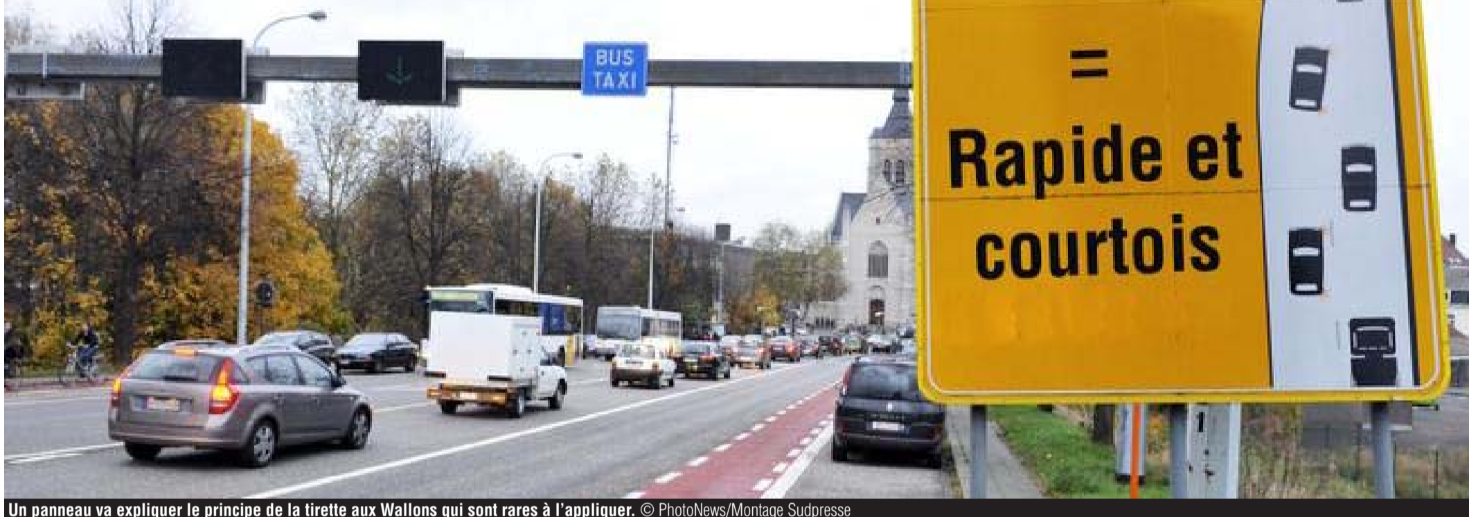
Un panneau va expliquer le principe de la tirette aux Wallons qui sont rares à l'appliquer.